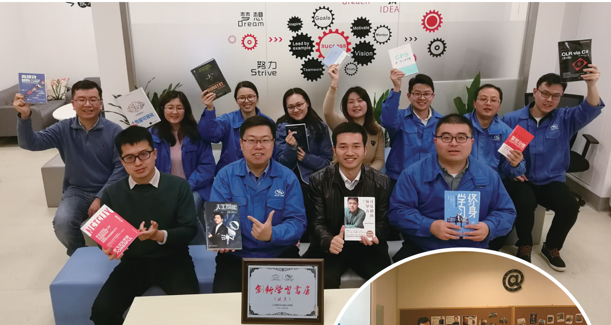
本报记者 林芸 本报通讯员 唐轶霖

汽车业的快速发展激发着从业者的高频学习需求。近年来，上汽各企业通过建立线上云学习平台与线下学习书房相结合的形式来适应上汽集团“新四化”发展战略。上汽通用汽车动力总成创新学习书房正是在这样的背景下应运而生。自2018年底成立以来，员工们在该书房通过建立机制、营造氛围、主题研讨等形式开展学习、交流、分享活动，围坐一起思考创新的思维模式，学习最新的技术，探讨业务的改进机会，并已通过实践应用将知识转化为业务成果。