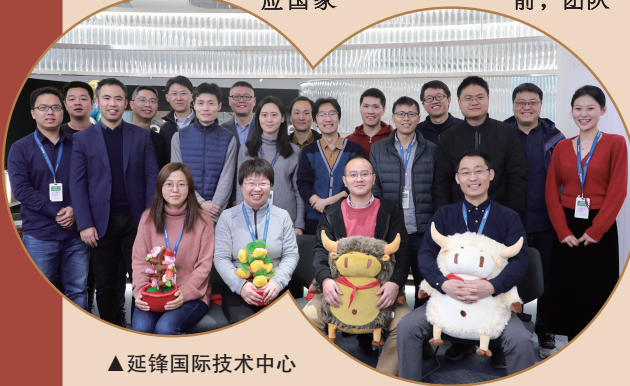
▲延锋国际技术中心电子工程研发团队