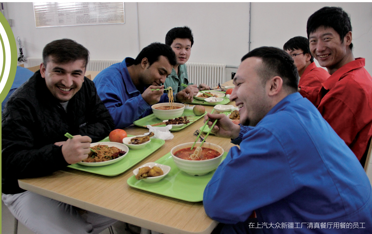
在上汽大众新疆工厂清真餐厅用餐的员工