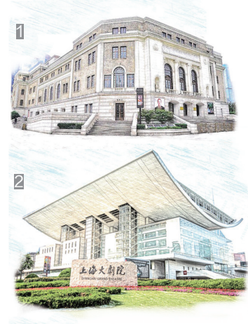
上海大剧院艺术中心旗下包括上海音乐厅(1)、上海大剧院(2)、上海文化广场三家剧场(3)

此次上海大剧院艺术中心与上汽集团达成冠名合作协议,确为具有战略眼光的双赢之举。本次合作将有助于上海大剧院艺术中心进一步提高引进与主办剧目的质量和数量,推广普及艺术教育等公益活动,为市民提供更多走进剧院的理由,同时,对上海大剧院艺术中心国际文化艺术交流和中国音乐剧产业的发展也将起到积极的推动作用。 (王莹)