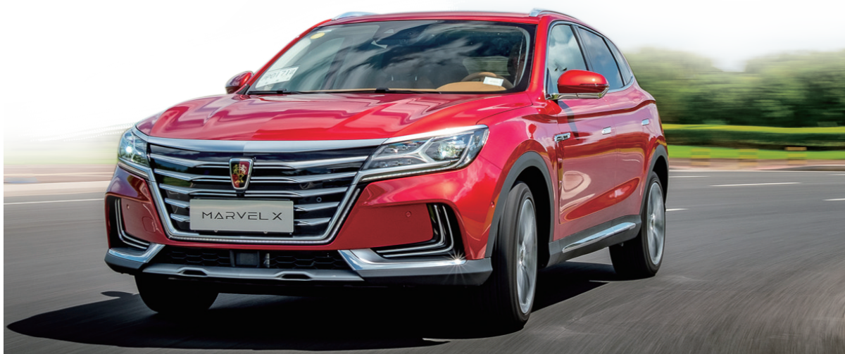
荣威 MARVEL X 后驱版保值回购方案示例(上海地区)

目前，保值回购活动已开始在6家门店试点，今后将争取覆盖更多地区；对于荣威 MARVEL X 的老车主，上汽荣威也计划推出更丰富的置换政策，照顾每一位“大威”的权益。