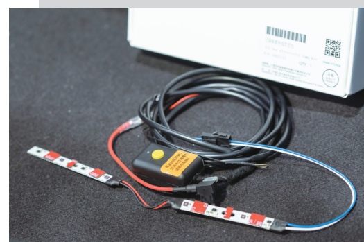
UVC深紫外线光学杀毒系统最快90秒就能完成全车消毒，并采用车用空调内置暗箱式布局，确保车内人员使用安全